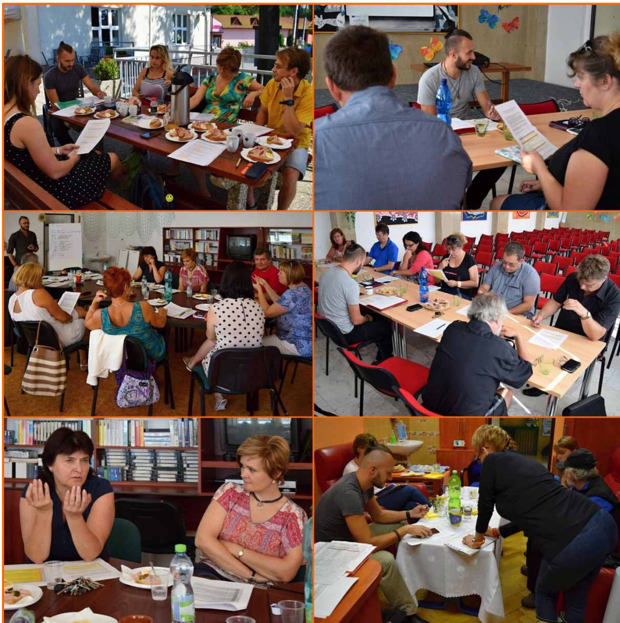
Obrázek č. 3: Jednání pracovních skupin

Strategický rámec je hierarchicky strukturovaný. Na vrcholu hierarchie stojí vize, která představuje nadčasové zhmotnění představ zapojených aktérů o budoucí podobě regionálního vzdělávání, výchovy a věcí souvisejících. Tuto vizi v období do roku 2023 naplňují stanovené priority a cíle. K formulaci každého cíle jsou pro lepší představu připojeny indikativní příklady opatření a aktivit, jejichž prostřednictvím je lze naplnit. Principiálně jsou však vítány jakékoli další zde nezmíněné aktivity, které k dosažení stanovených cílů přispívají. Problematickým momentem formulace priorit a cílů je však skutečnost, že strategický rámec je zdrojově a organizačně ukotven ve vzduchoprázdnu (viz níže).